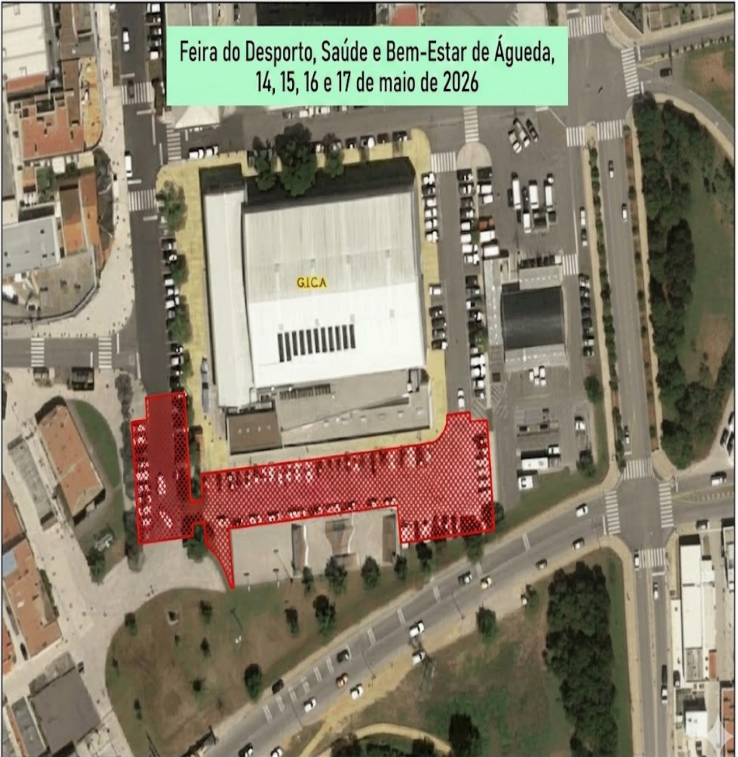
Base Cartográfica : OrsSa2023-Difcomagees de 2025, Propriedade da Direção-Geral do Território