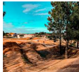
Águeda Bike Park