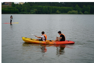
Atividades Náuticas na Pateira de Óis da Ribeira