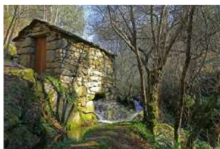
Percursos Pedestres de Águeda