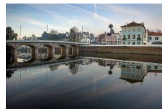
Percursos Náuticos Grande Rota da Ria de Aveiro (Percurso G)