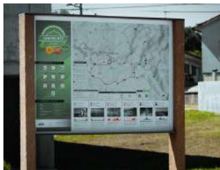
Trilhos de BTT de Águeda