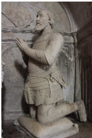
Estátua orante de D. Duarte Lemos Philippe Hodart (Séc. XV-XVI)