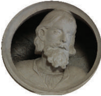
Medalhão do Frontão sobre o túmulo de D. Duarte de Lemos