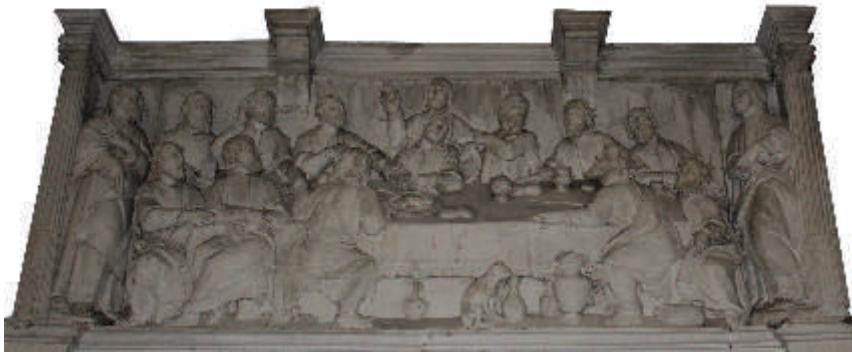
Retábulo da Última Ceia Capela do Sacramento (topo) da Igreja de Santa Eulália, Águeda