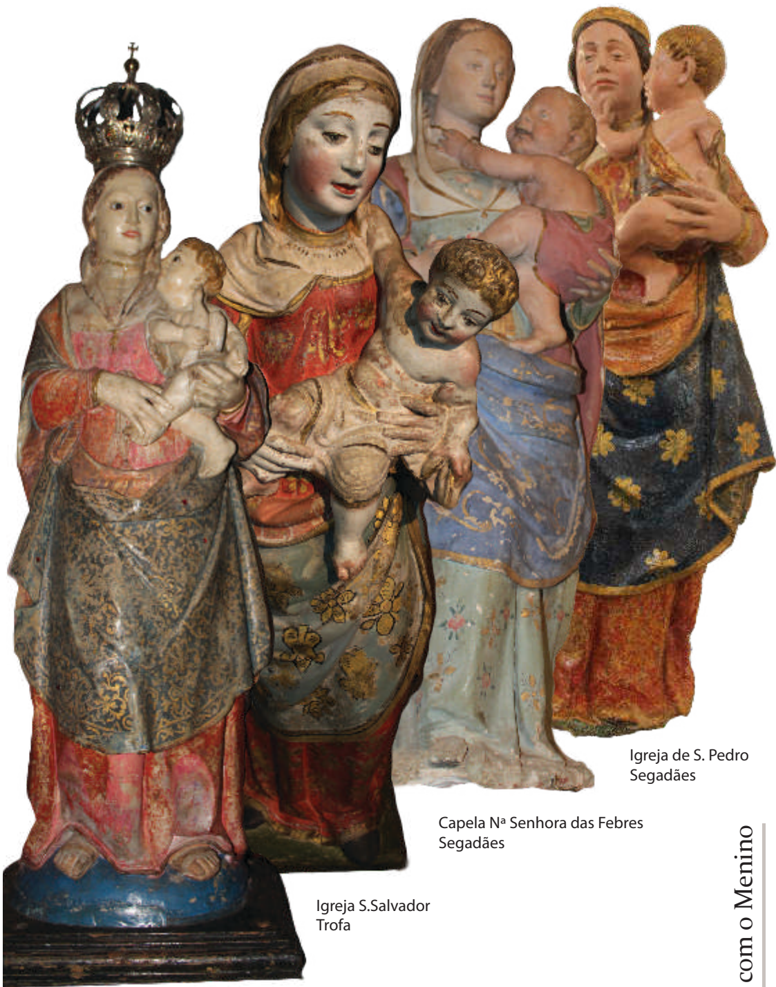
Capela N a Senhora da Graça Assequins