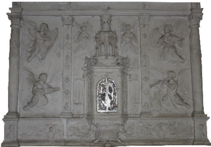
Retábulo do Sacramento Capela do Sacramento da Igreja de Santa Eulália, Águeda