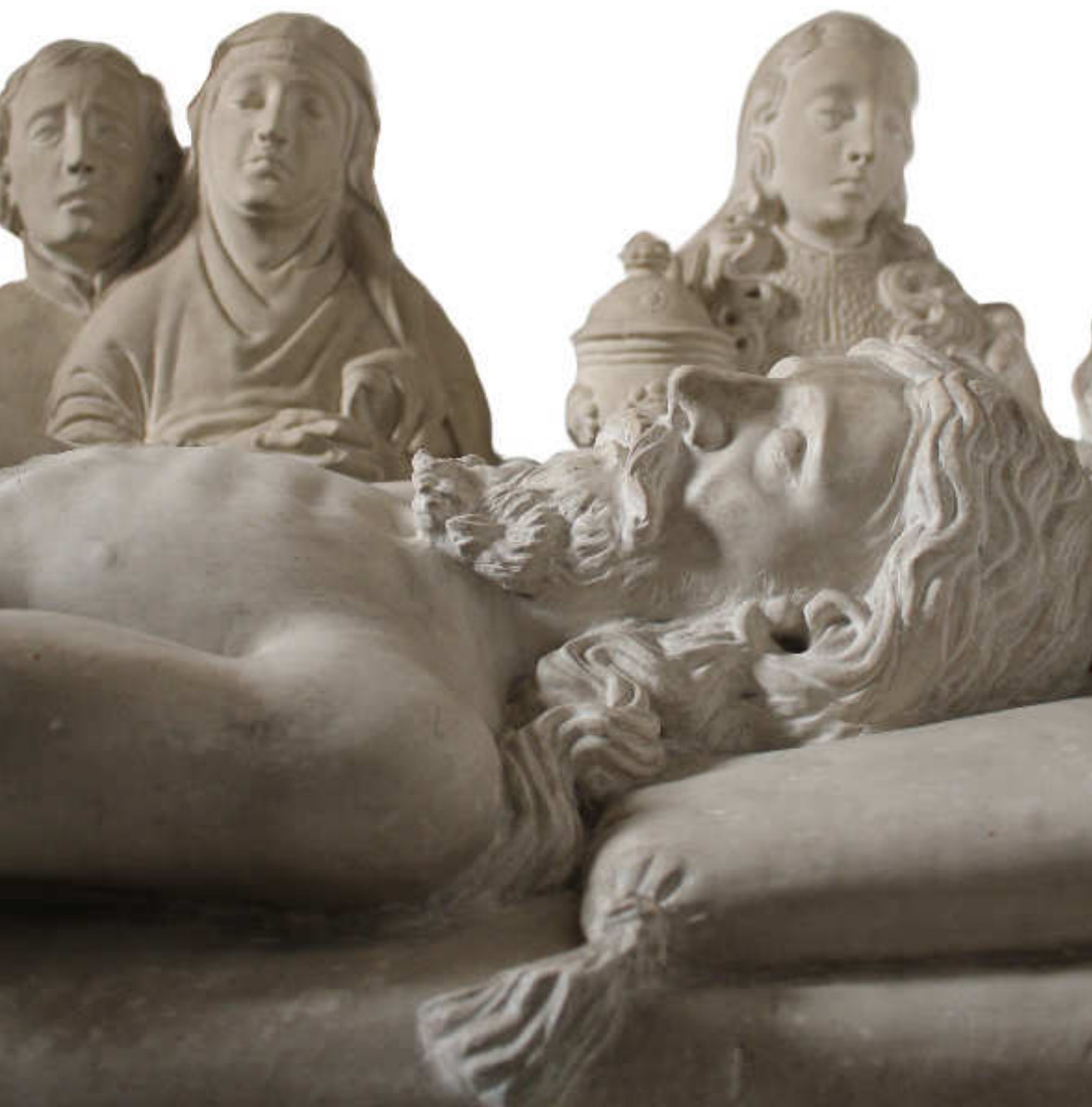
Pormenor do conjunto escultórico da Capela da Deposição Igreja de Santa Eulália, Águeda