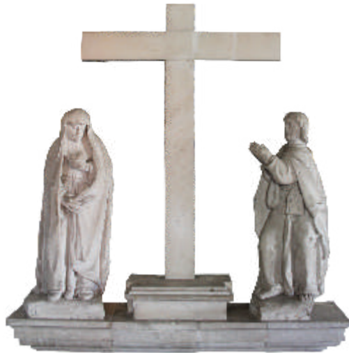
Calvário com Nossa Senhora e S. João Entrada lateral da Igreja