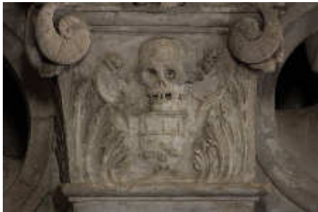
Capitel da pilastra entre os túmulos de D. Duarte e D. Joana