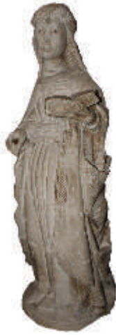
Imagem de Santa Eulália Igreja de Águeda