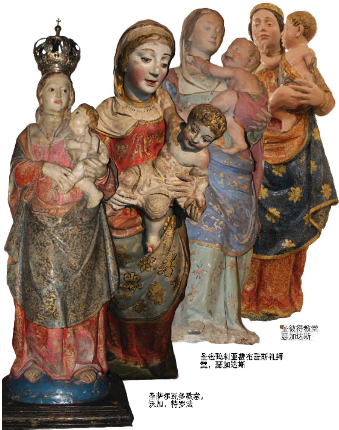
圣彼得教堂 瑟加达斯