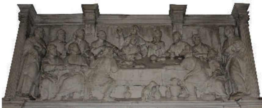
最后的晚餐祭坛，圣尤拉利亚圣礼礼拜堂（上图），阿格达