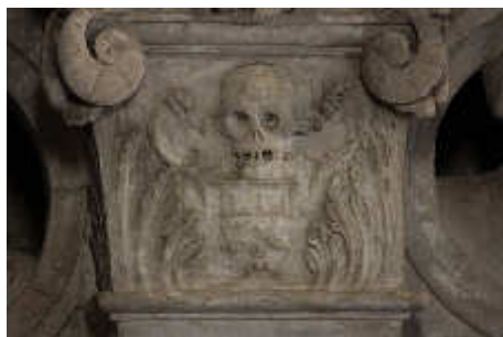
D.杜阿尔之墓与D.乔安娜之 墓之间的壁柱帽