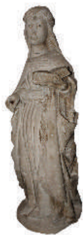
圣尤拉利亚雕像，阿 穆法教堂