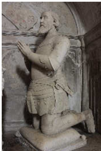
D.杜阿尔·穆莱贾斯祈祷像 菲列普·胡达特（15世纪-16世纪）