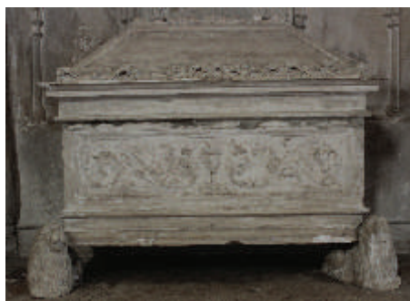
D.乔安娜·德·莱莫斯之墓上, 朱西河的哥伦