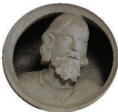
D.杜阿尔,德·莱莫斯之墓, 山花上的勋章