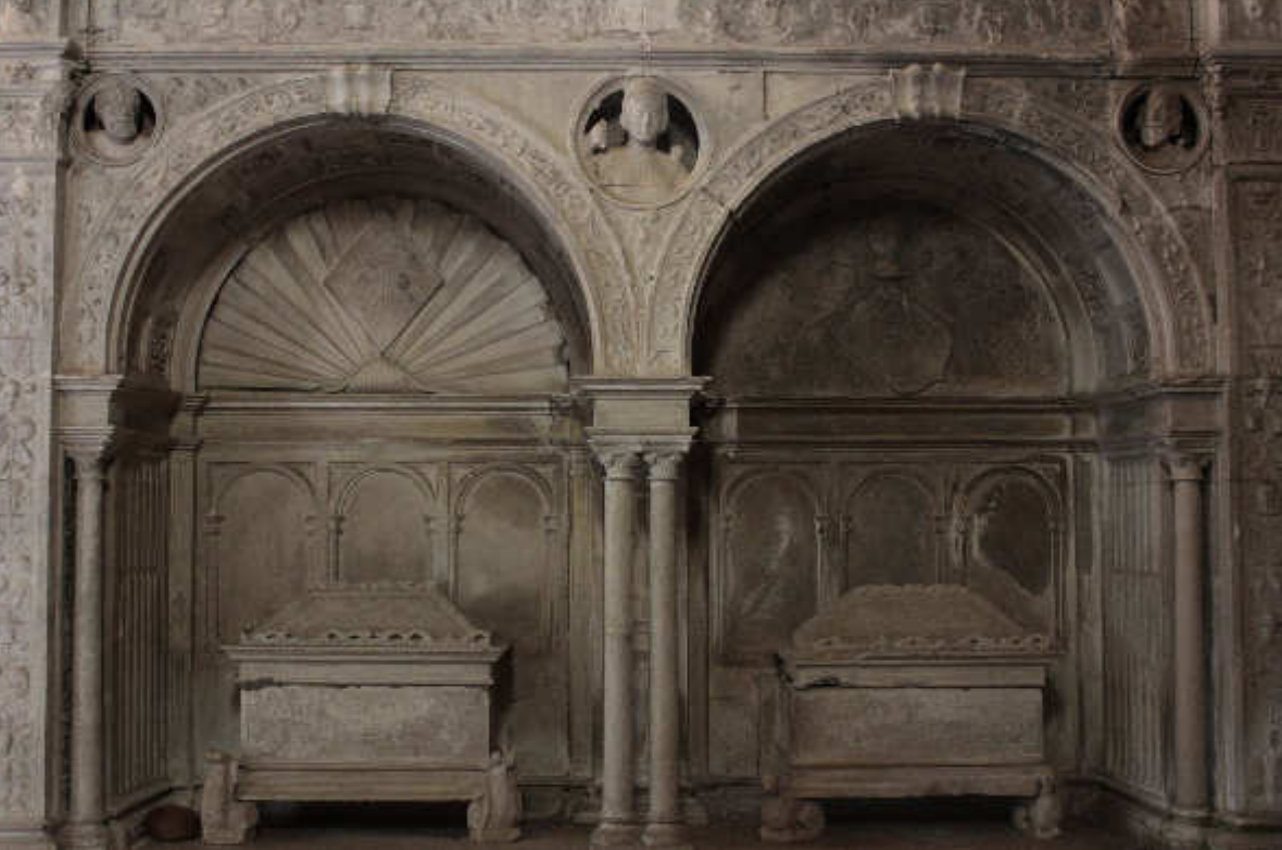
Arcosolium avec urnes ossuaires, dans le côté de l'Évangile