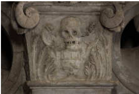
Chapiteau de la pilastre entre les tombeaux de D. Duarte et de D. Joana