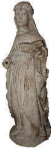
Image de Santa Eulália Eglise de Águeda