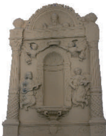
Maître-autel de la Chapelle de Nossa Senhora de Lourdes Trofa, Águeda