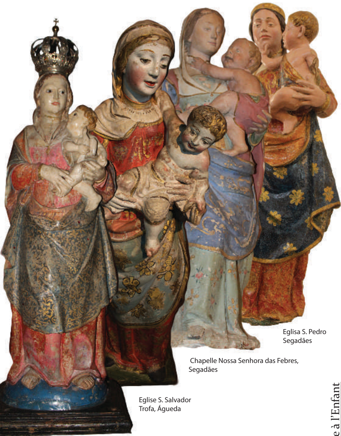
Chapelle Nossa Senhora da Graça, Asseguins