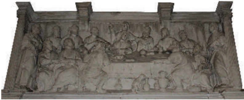
Retable de la Dernière Cène, Chapelle du Saint-Sacrement (haut) de l'Eglise Santa Eulália, Águeda