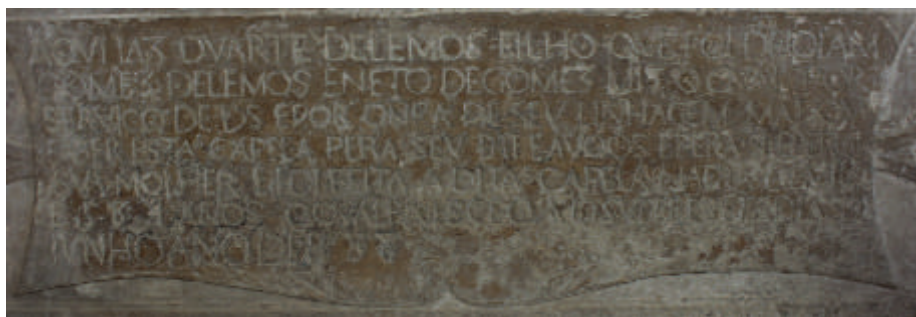
Épitaphe du tombeau de D. Duarte de Lemos, dans le côté de l'Épître