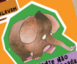
O Elefante Não ENTRA Na Jogada