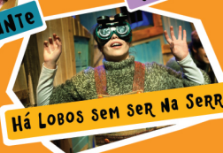
Há Lobos sem ser Na Serra