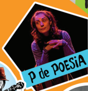
P de POESIA