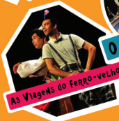
As Viagens do Ferro-velho