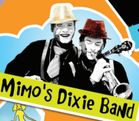
Mimo's Dixie Band